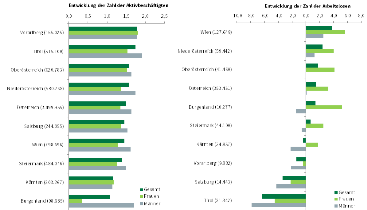
Entwicklung der Aktivbeschäftigten sowie Arbeitslosen 2016 nach Bundesländern