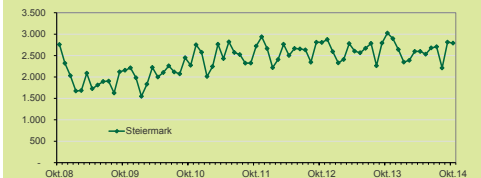
Technische Produktion = Gesamtproduktion (Eigenproduktion und durchgeführte Lohnarbeit bewertet mit dem für die Arbeit erhaltenen Lohngrößen).

Quelle: STATISTIK AUSTRIA, Konjunkturerhebung, Berechnungen JR-POLICIES.